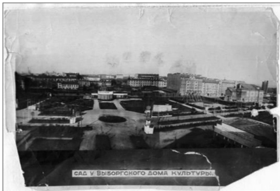
Выборгский сад, год съемки неизвестен (возможно – не позднее 1933)